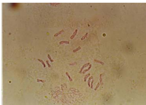
شکل ۱- نمونه شاهد.

موتاسیون‌ها تغییرات ناگهانی ارثی هستند که اساس تنوع ژنتیکی و ماده خام تکامل را بوجود می‌آورند. وظیفه اصلاحگر تشخیص و استفاده از آنها در اصلاح نباتات است. اگر چه به طور کلی وفور نسبی موتاسیون‌ها اندک است، لیکن بطور دائم موتاسیون اتفاق می‌افتد و تراکم بعضی از آنها در جامعه