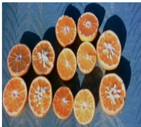
نمونه‌های بدون هسته موانت - هسته‌دار شاهد.