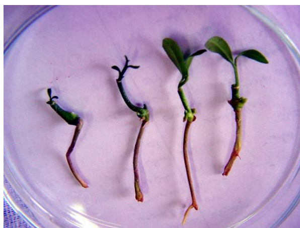
پیوند بر پایه پونسیروس.

نمونه‌های موفق به گلدان انتقال داده شدند تا پس از رشد، برای تکثیر به عنوان پیوندک مورد استفاده قرار گیرند. پیوندک نارنگی کلمانتین از درختان مادری سالم تهیه و با محلول کاپتان ضدعفونی شد و سر شاخه‌های حامل پیوندک با چسب باغبانی پوشیده شدند شکلهای ۳ و ۴ نمونه‌های موفق پیوند را نشان می‌دهند. شاخه‌های حاوی پیوندک با دُزهای ۳۵، ۴۰ و ۴۵ گری پرتوهای گاما، پرتوتابی شده و بلافاصله به مؤسسه تحقیقات مرکبات رامسر منتقل و بر روی پایه نارنج موجود در گلدان‌های پلاستیکی در گلخانه به تفکیک پیوند زده شده ( M_1V_1 ) از گرفتن پیوندهای موفق سر برداری شد و پس از رشد کافی گرفتن پیوندهای موفق به هرس آنها اقدام گردید بطوریکه دو جوانه در هر نهال باقی گذاشته شد و بقیه که حدود ۵ جوانه از هر نهال بود بر روی پایه‌های نارنج موجود در کیسه پلاستیکی پیوند زده شدند ( M_1V_2 ).